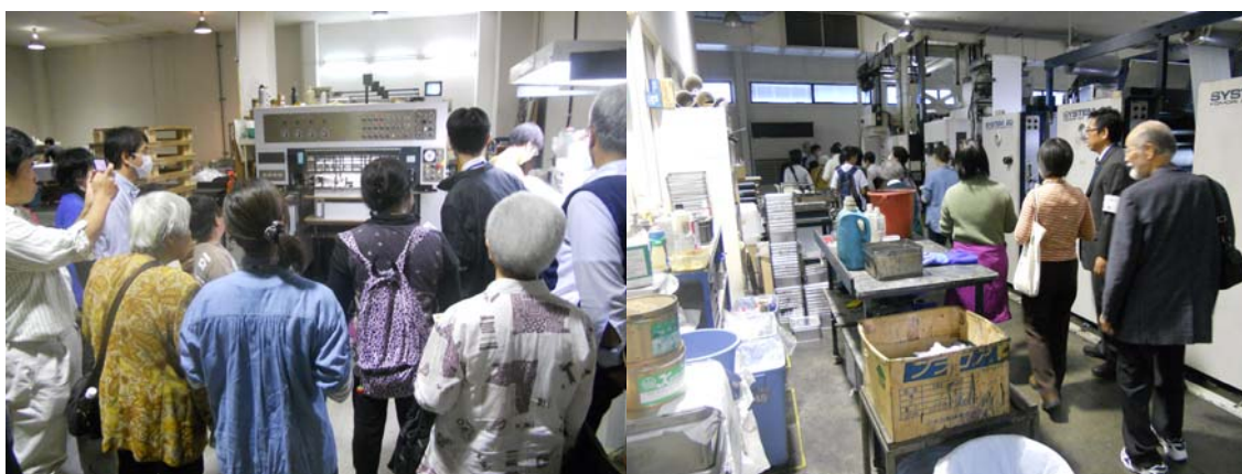
写真を撮ったり、メモをしたり、熱心に見学