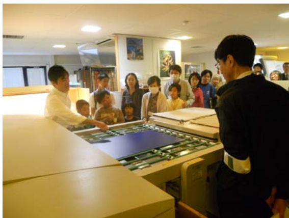
プリプレスー 印刷物の原版を作ります

工場見学は数名のグループに分かれ、スタッフが皆さんをご案内しながら一時間かけて館内を見学しました。